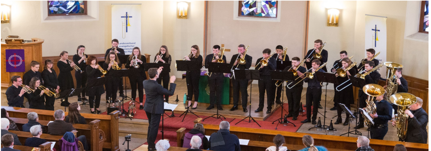
Konzert des Jugendposaunenchors in Lustadt

Der Jugendposaunenchor Pfalz wurde 2010 als Auswahlensemble der evangelischen Posaunenchoräle der Pfalz gegründet. Heute musizieren ca.