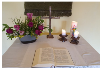
Blumenschmuck in Frankeneck

Start ist um 18.00 Uhr Ecke Schlossgasse/Große Äcker