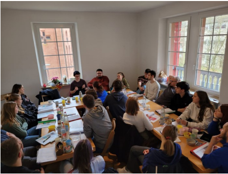
Vorbereitungstreffen der Zeltlager im Pfarrhaus

Die Mitglieder des Presbyteriums freuen sich nun auf ihre Mieter, aber auch darüber einen Teil des schönen Pfarrhauses langfristig für Sitzungen, Kinderkino, Konfi-Arbeit oder Winterkirche nutzen zu können.